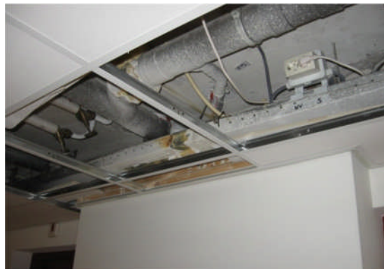
Schacht met doorvoeringen boven het plafond