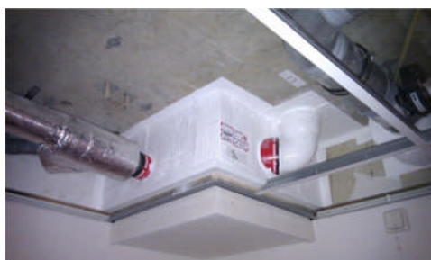
Maatwerk in de uitvoering (brandwerende koof)

Ook opereren wij als deskundige partij in overleg met gemeentelijke instanties. Voor elk onderdeel kan de bouwproces-manager eventueel een gekwalificeerde gesprekspartner inschakelen, bijvoorbeeld een deskundige op het gebied van brandmeldingsinstallaties (BMI's). Daarnaast worden opleveringen met de gemeentelijke instanties georganiseerd, zowel tussentijds als na afronding van de werkzaamheden.