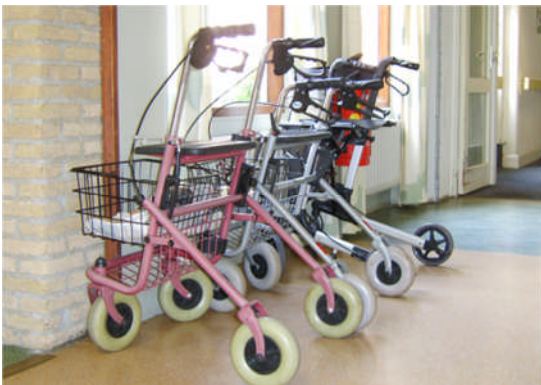
Minder mobiel is minder zelfredzaam

Tijdens de inventarisatie van de aannemers zal de brandadviseur meelopen om vragen te beantwoorden. Wij sturen en begeleiden dit proces, zodat de opdrachtgever het door ons uitgebrachte advies kan gebruiken bij het kiezen van de juiste bouwpartner.