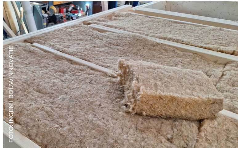
Biobased isolatie in een HSB-element.

Is dit dan erg? “Dat kun je jezelf afvragen, want de energieprestatie wordt beoordeeld op gebouwniveau, waarbij tevens de invloed van oriëntatie, daglichtopeningen en bijvoorbeeld overstekken op opwarming door zoninstraling wordt meegenomen. Die invloed is in de praktijk veel groter, waardoor het voordeel van een grotere faseverschuiving al snel teniet wordt gedaan. Het gunstige effect op elementniveau is er wel degelijk, maar voor het merkbare effect moet het gehele woonconcept hierop afgestemd zijn en moeten bewoners ook actief gebruik maken van zomernachtventilatie. In een dergelijke ‘statische’ berekening kan immers geen rekening worden gehouden met bewonersgedrag en de werkelijke mate van zonnestraling.”